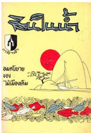
ภาพที่ 3: นวนิยายเรื่องสินในน้ำ

ข่าวการขึ้นฝั่งของแม่สายทำให้ความลับเกี่ยวกับกำเนิดของรุ่งเปิดเผย บิดาของรุ่งคือขุนเจริญ เดิมเป็นเจ้าหน้าที่ปราบสลัดที่คอยปล้นเรือ เจริญกลายเป็นเศรษฐีใหญ่ที่ร่ำรวยด้วยการขายพลอยที่งมได้จากสำเภาสินค้าที่จม จึงทิ้งสายและลูกไปมีภรรยาใหม่ ซึ่งหน้าตาคล้ายรุ่งชื่อ “อรุณ”