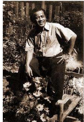
ภาพที่ 1: ก้าน พึ่งบุญ ณ อยุธยา

ไม้ เมืองเดิมซึ่งเป็นนามปากกาของ ก้าน พึ่งบุญ ณ อยุธยา เกิดเมื่อวันที่ 16 มิถุนายน พ.ศ. 2448 ที่กรุงเทพฯ แม้จะมีเชื้อสายผู้ดี แต่ก็ดูเหมือนเป็น “ผู้ติดกยาก” เขาเรียนจบชั้นมัธยมวัดบวรนิเวศ รัชราชการที่กรมบัญชีการมหาดเล็กได้ประมาณ 4 ปีก็ลาออกมาทำงานส่วนตัวและเร่ร่อนไปตามชนบทได้ประมาณ 9 ปีเศษก็กลับถึงกรุงเทพฯ และเริ่มเขียนหนังสือเมื่อ พ.ศ. 2478 (ประทีป เหมือนนิล, 2542: 20) ในระหว่างที่เร่ร่อนไปตามชนบทนั่นเองคงจะเป็นช่วงเวลาที่เขาได้สัมผัสกับชีวิตชาวบ้าน และได้ซึมซับวิถีชีวิตและจิตใจของชาวชนบท