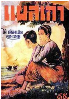
ภาพที่ 2: นวนิยายเรื่อง แผลเก่า

มีนวนิยาย 2 เรื่องที่แสดงให้เห็นการปะทะระหว่างเมืองกับชนบท คือเรื่อง แผลเก่า และ สินในน้ำ